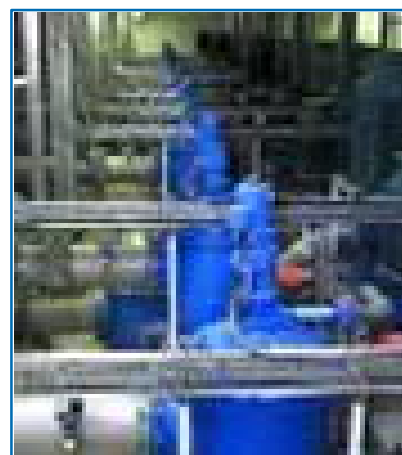
Instalação do Bollfilter pré-filtragem.