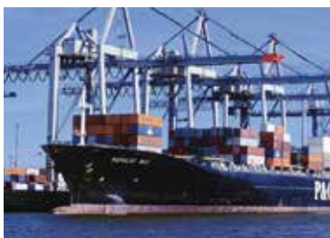
El Filtro automático-BOLL Tipo 6.64

Aplicaciones diversas. p. ej.: Filtrado de aceites lubrificantes en motores Diesel,