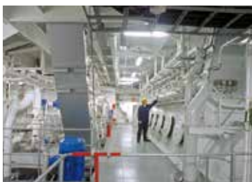
Filtración de combustibles

Aplicaciones diversas. p. ej.: Filtrado de aceites lubrificantes en motores Diesel,