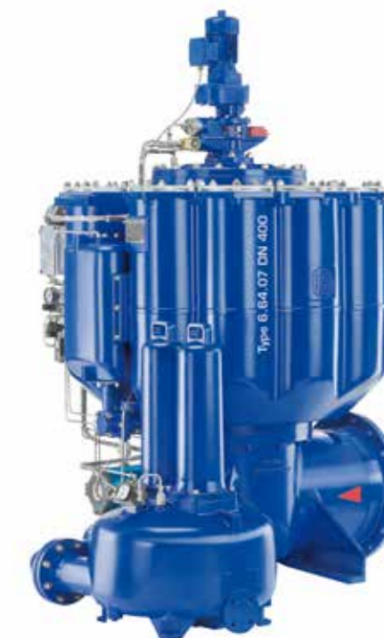
BOLL-FILTRO Automático Tipo 6.6407 DN 400 con unidad de recuperación para el líquido de lavado