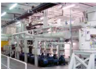
Filtración de fluidos de lubricación refrigerante en instalaciones de mecanizado y cadenas transfer

(La fotografía muestra una instalación de la fábrica Burener Maschinenfabrik GmbH.)